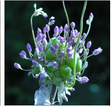
Babingtonløg, Allium ampeloprasum , Babingtonløg, porreløg FS0188