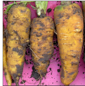
Gulerod, Daucus carota , Bosnisk Gul Ærø selection FS0589