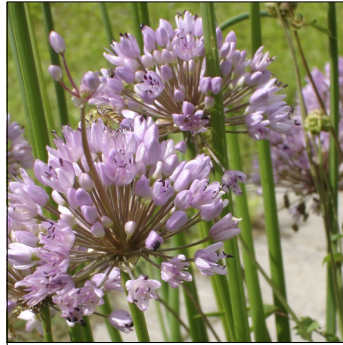
Kinaløg, Allium tuberosum , Kinaløg