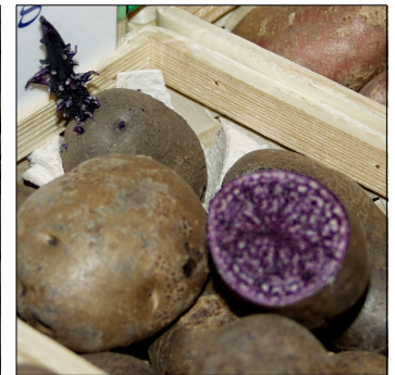
Kartoffel, Solanum tuberosum , Blå Congo FS0593