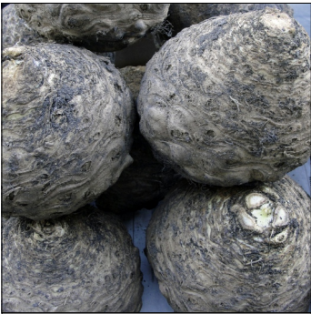
Knoldselleri, Apium graveolens , Knoldselleri usn.1 FS0518