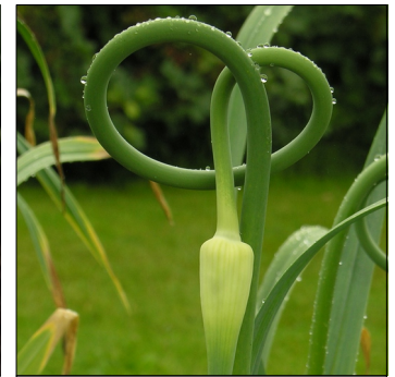
Hvidløg, Allium sativum , Reberg Knoblauch FS0009