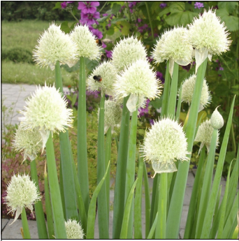
Pibeløg, Allium fistulosum , Pibeløg