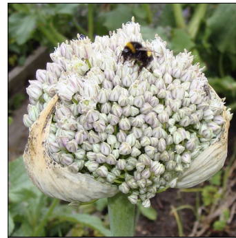
Porre, Allium ampeloprasum , Flag FS0185