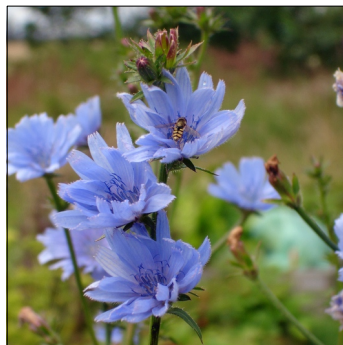
Cikorie, Cichorium intybus , Cikorie