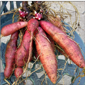
Yacon, Polymnia sonchifolia , Yacon FS0496