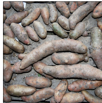
Kartoffel, Solanum tuberosum , Rosa tannenzapfen