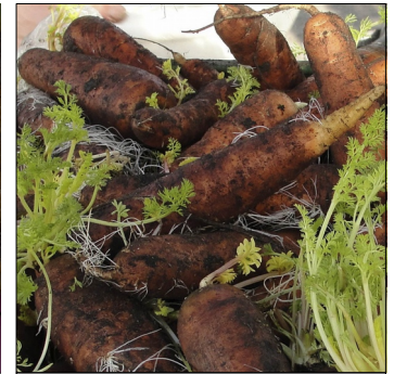
Gulerod, Daucus carota , Nantes Fancy, Hegnstrup stamme FS0591