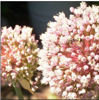
Porre, Allium ampeloprasum , Carentan FS0184