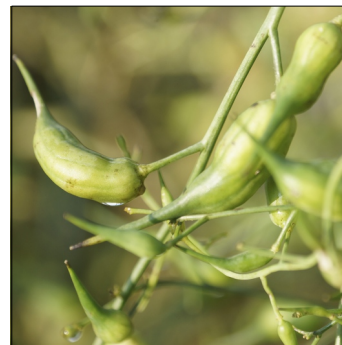
Radis, skulpe-, Raphanus raphanistrum subsp. sativus , München Bier