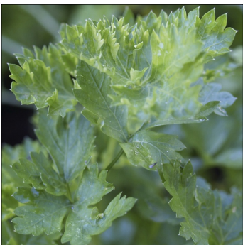
Persille, Petroselinum crispum , Glatbladet Kurdisk FS0324