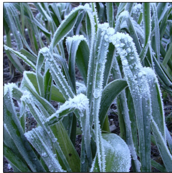
Porre, Allium ampeloprasum , Musselburgh FS0187