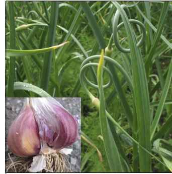
Hvidløg, Allium sativum , Estisk rød FS0010