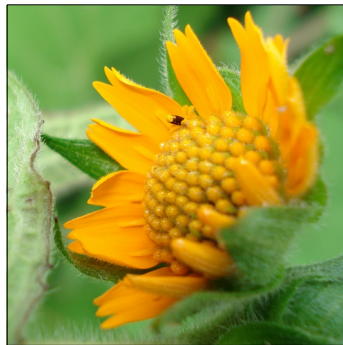
Yacon, Polymnia sonchifolia , Yacon FS0496