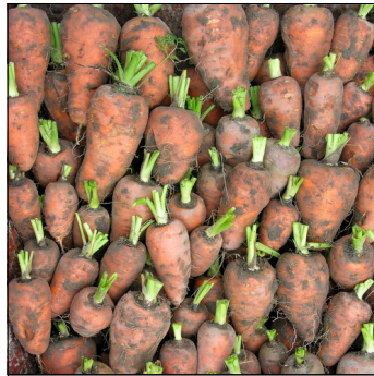
Gulerod, Daucus carota , Early Scarlet Horn FS0588